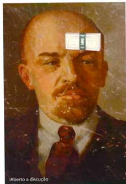
Aberto a discussão

Rua do Campo Santo, n.º 92 2765-306 Galiza, S. João do Estoril Tel.: 214 684 172 Tel. Móvel: 966 961 062 E-mail: wayofartslda@gmail.com Website: www.wayofarts.com